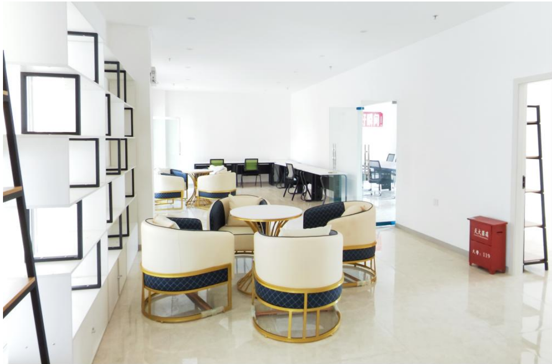
信息学院电子商务实训室接待室