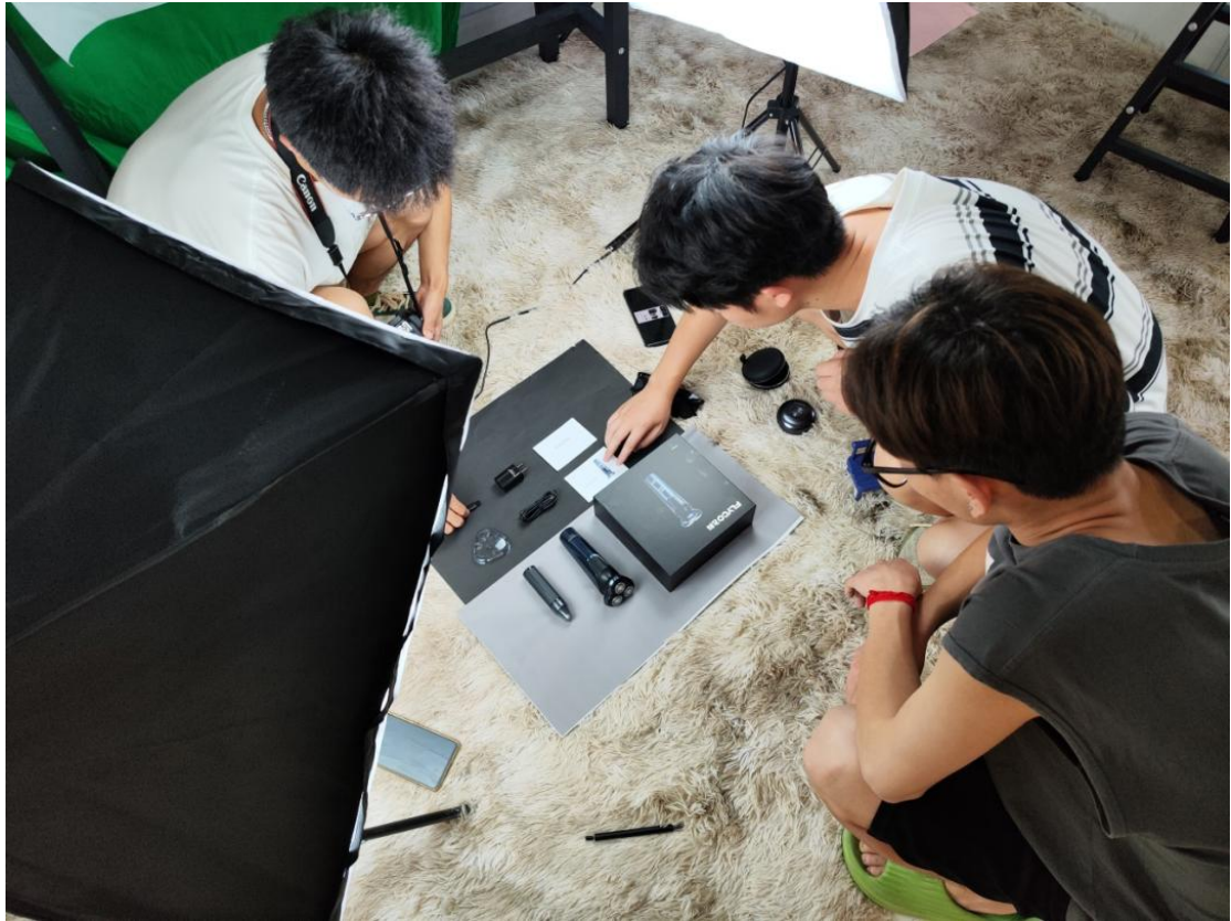
视觉营销设计实训现场